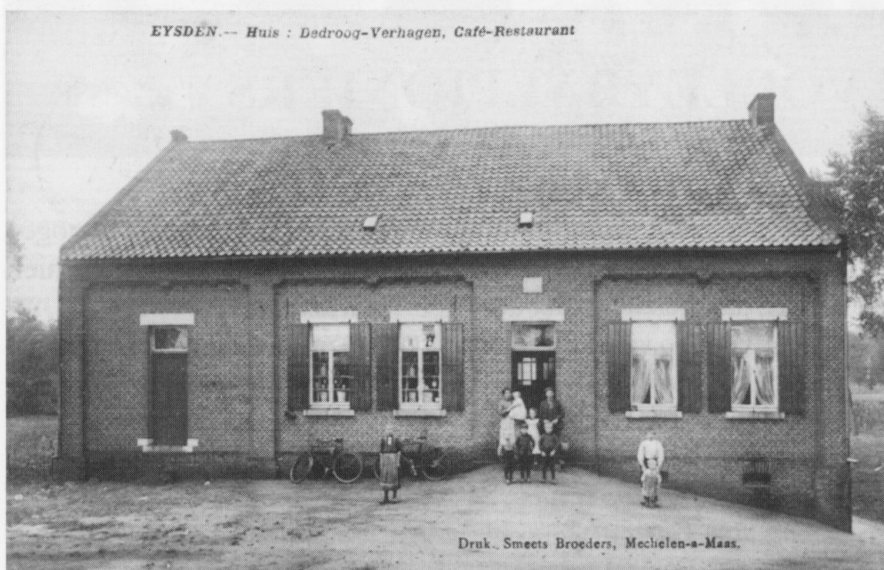
huis Dedroog - Verhagen